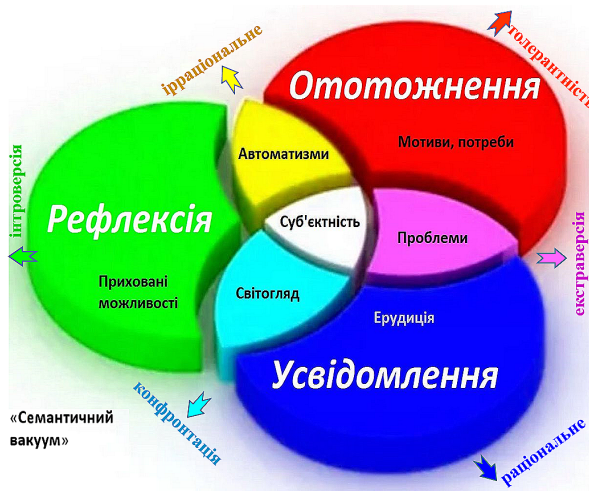
Рис. 1. Модель семантичного простору суб'єкта