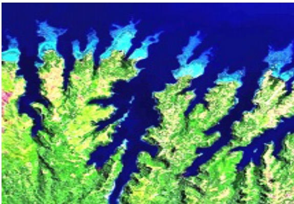
Рис. 2. Задача про довжину берегової лінії

«мінімальний піксель» простору має визначений розмір: 1,61624(12) \times 10^{-35} \text{ м} — це довжина Планка. Однак математичне уявлення про неперервність суперечить представленню числової осі навіть безліччю щільно упакованих точок абсолютно нульового розміру, адже в цьому випадку континуум є ніщо. Основною властивістю континууму вважають його недиз'юнктивність (неподільна цілісність), — тому будь-яке визначення його як множини, складеної з безмежно малих дискретних об'єктів, є нонсенсом.