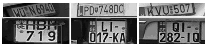
Рис. 5. Примеры ошибок уточнения положения номеров на изображениях

• Среднее время обработки входного изображения размерами 800×600 и 1600×1200 составляет соответственно 0,12 с и 0,45 с.