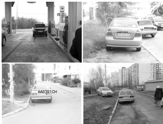
Рис. 6. Примеры распознавания автомобильных номеров на изображениях

С уменьшением размера номера усложняется задача его поиска и распознавания на изображении, так как возрастает уровень искажения символов при изменении угла съемки, ошибок дискретизации и бинаризации, а также вероятность их возможного слияния или касания друг с другом и с рамкой номера. С другой стороны, при распознавании номеров с малыми размерами появляется возможность более дальнего видеонаблюдения и контроля.