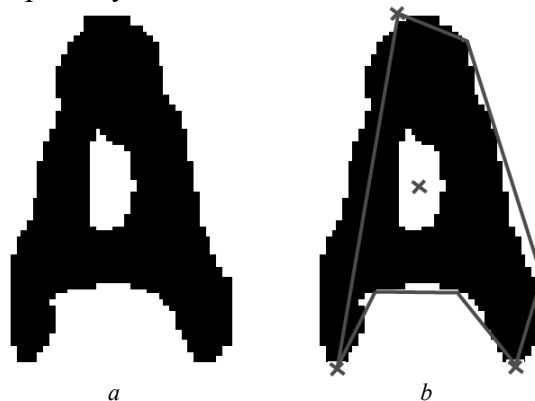
Рис. 3. a – бинаризованное изображение символа; b – четыре особые точки (обозначены крестиками) на этом изображении: 3 основные особые точки на аппроксимированном контуре изображения (концы линий) и одна дополнительная особая точка (центр внутреннего контура на изображении буквы A )

Параметрами дополнительной особой точки есть нормированные координаты этой точки и размеры минимального прямоугольника, ограничивающего соответствующий внутренний контур.