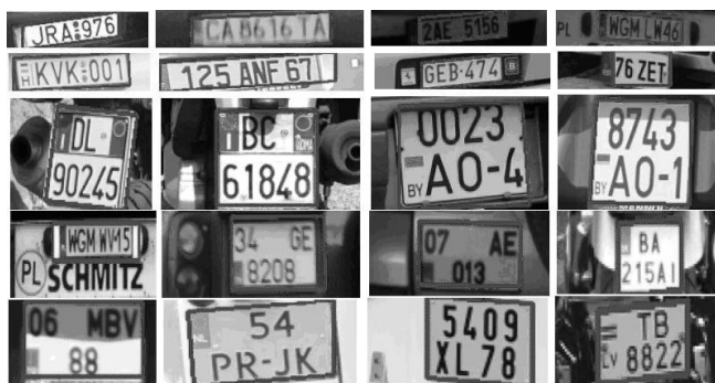
Рис. 4. Результаты уточнения положения номеров на предварительно выделенных фрагментах изображений

Примеры изображений из указанных выше трех классов и результаты их обработки представлены на рис. 4. Примеры ошибок уточнения положения номеров (около одного процента) представлены на рис. 5.