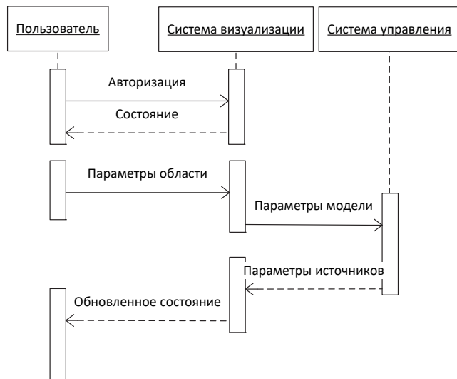
Рис. 2. Диаграмма последовательности для задачи идентификации интенсивности источников загрязнения

входных данных модели. Параметры области передаются в систему управления, которая формирует описание задачи, передает на исполнение, получает результаты, обновляет БД и вызывает обновление статуса системы визуализации. Система визуализации добавляет результаты оценки к описанию источников выбросов. Пользователь повторно анализирует состояние загрязнения, и может повторить процедуру идентификации.