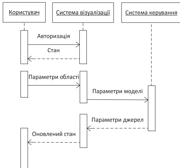
Рис. 2. Діаграма послідовності для задачі ідентифікації інтенсивності джерел забруднення

завдання, передає його на виконання, отримує результати, оновлює БД та викликає оновлення статусу системи візуалізації. Остання додає результати оцінки до опису джерел викидів. Користувач повторно аналізує динамічно оновлюваний стан забруднення та може повторити процедуру ідентифікації.