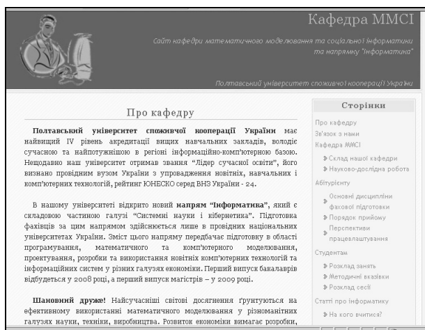
Рис. 1. Сайт кафедры математического моделирования и социальной информатики университета

• Создание полнофункционального кафедрального сайта как самостоятельного сайта, например http://informatics.org.ua/about (рис. 1),