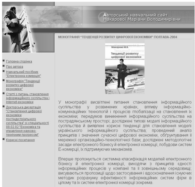
Рис. 3. Размещение на предметном сайте оригиналов научных материалов

Таким образом, глобальная сеть Internet , со своими технологиями – катализатор разнообразных организационных эффектов, способна внести большую лепту и в организацию самостоятельной работы студента университета, ищущего выход на эффективно систематизированные предметные знания.